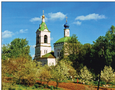
Казанский Храм. Село Шеметово