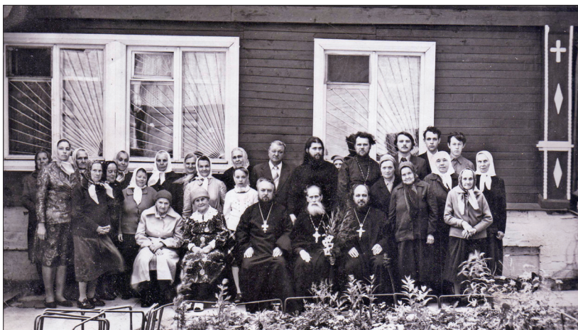
У сторожки Казанского храма с. Шеметово (ок. 1980 г.)