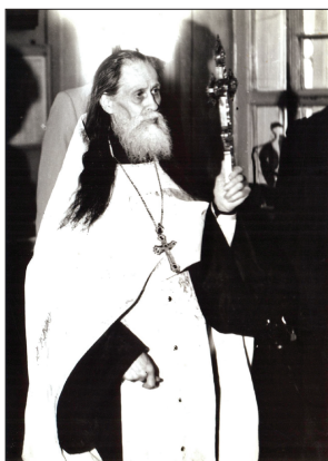
Архимандрит Герман (Красильников)