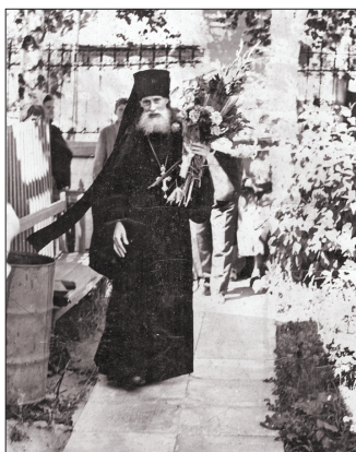
Именины 11 июля, начало 80-х годов