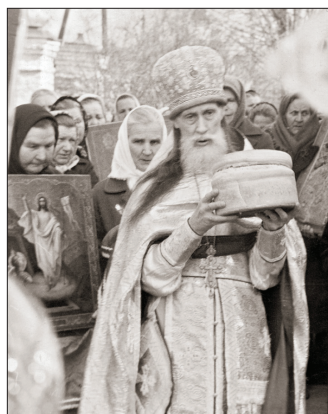
Крестный ход на Пасху